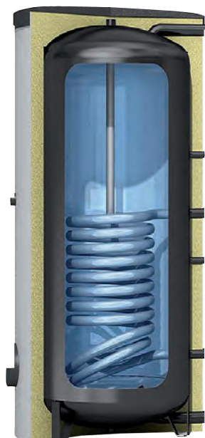
Modello RS con scambiatore di calore integrato a tubo liscio